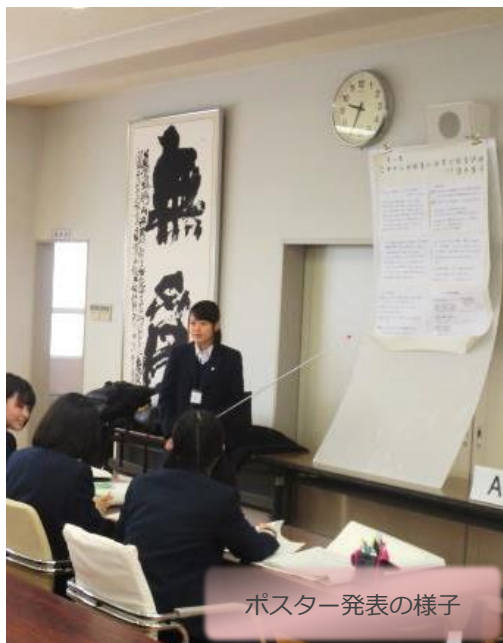
ポスター発表の様子