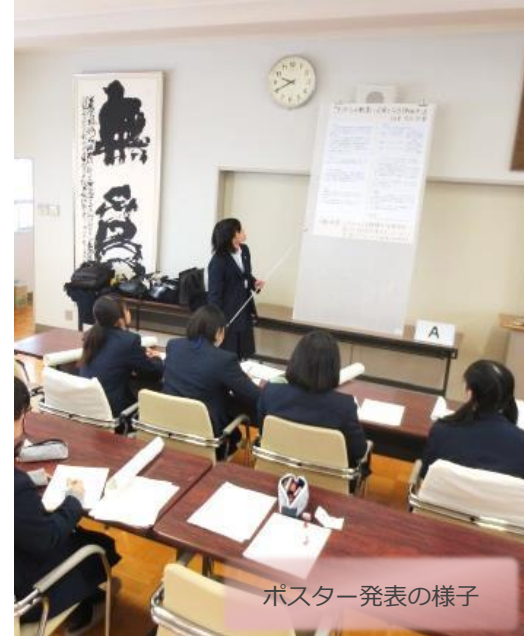
ポスター発表の様子