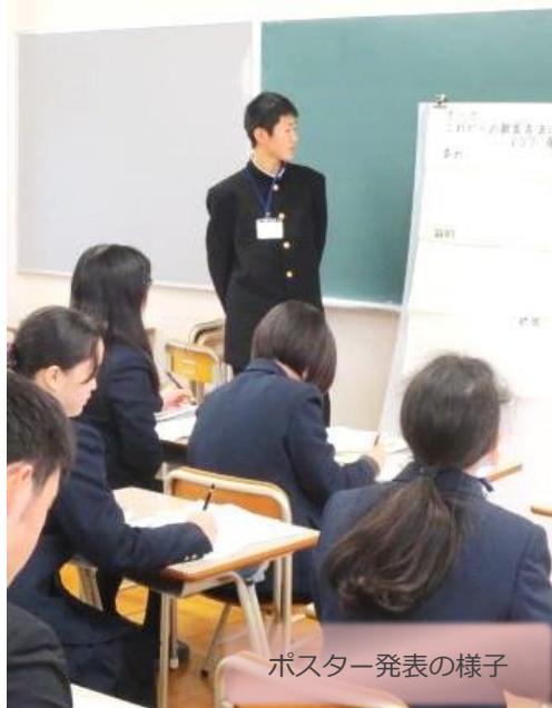
ポスター発表の様子