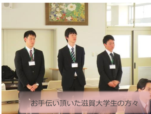
お手伝い頂いた滋賀大学生の方々